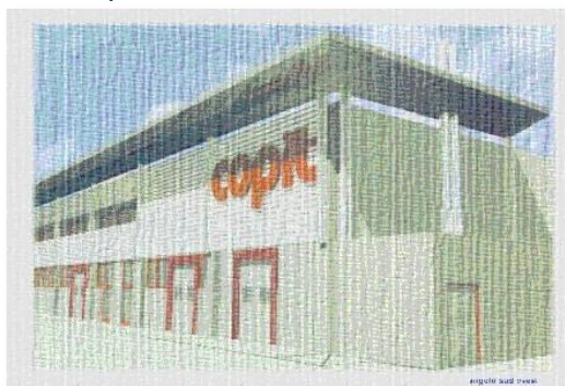
Copit, l'Officina – Deposito di Pistoia, Via dell'Annona (inaugurazione anno 2003)